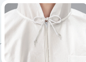
■フード紐入り 自由に調節可能