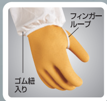
■フィンガーループ付 袖がめくれるのを防ぎます。